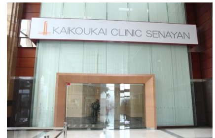
KAIKOUKAI CLINIC SENAYAN Berlokasi di Sentral Senayan 1

KHG yang berpusat di Rumah Sakit Nagoya Kyoritsu, terkenal dengan pelayanan kesehatan yang invasif minimal seperti pada terapi radiasi dan pengobatan penyakit pembuluh darah dengan menggunakan teknik kateterisasi, serta dikenal memberikan pelayanan kesehatan yang berkualitas tinggi oleh tim dokter, perawat, farmasi (obat-obatan) dan dukungan profesional dari tim khusus lainnya.