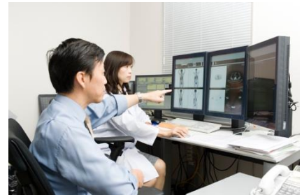
Pembacaan Hasil Radiologi

Dengan mendapatkan second opinion , pasien dapat mempertimbangkan pendapat dari dokter yang menanganinya dengan sudut pandang yang lain. Sehingga pemahaman pasien terhadap penyakitnya akan semakin mendalam, sekalipun mendapatkan diagnosis atau penjelasan metode pengobatan yang sama.